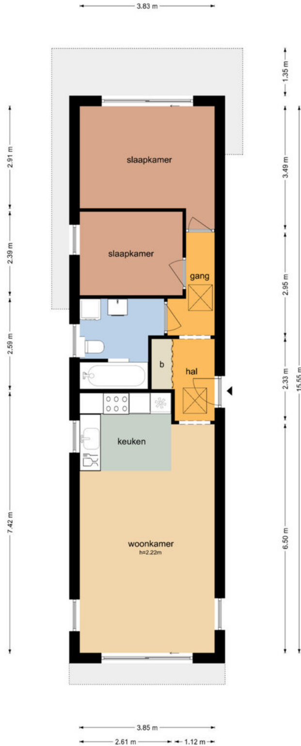
Waarderhaven 18 - Haarlem Begane Grond

De plattegronden zijn geproduceerd voor promotionele doeleinden en ter indicatie. Aan de plattegronden kunnen geen rechten worden ontleend. © www.objectenco.nl