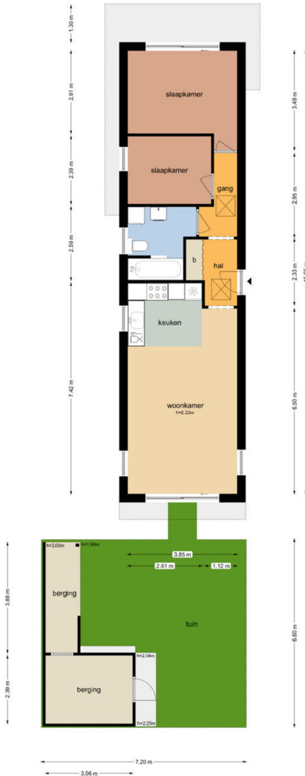
Waarderhaven 18 - Haarlem Tuin

De plattegronden zijn geproduceerd voor promotionele doeleinden en ter indicatie. Aan de plattegronden kunnen geen rechten worden ontleend. © www.objectenco.nl